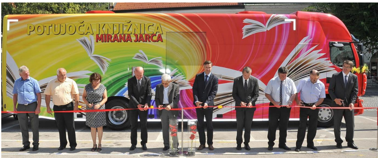
2. 9. 2016 je na Glavnem Trgu v Novem mestu potekala otvoritev novega bibliobusa s pestrim programom za vse generacije.

Dogodek se je začel z ustvarjalnimi delavnicami za najmlajše uporabnike, na katerih so otroci izdelovali lesene bibliobuse. Sledil je slavnostni preraz traku, katerega so se udeležili tudi minister za kulturo Anton Peršak in župani občin pogodbenih partneric knjižnice. Bibliobusu smo skupaj s številnimi obiskovalci zaželeli dolgo in srečno vožnjo.