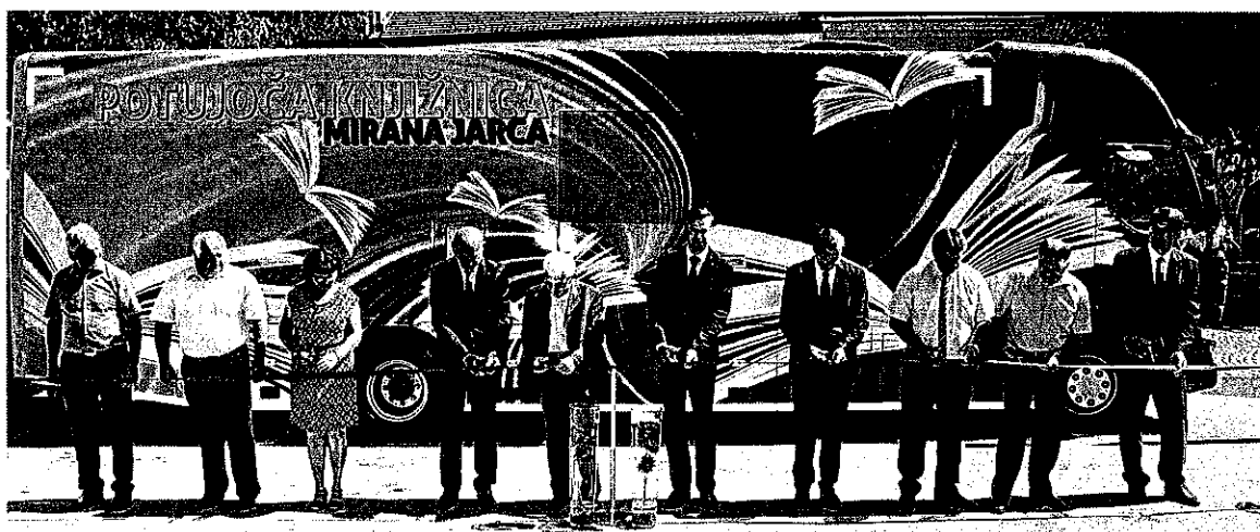
2. 9. 2016 je na Glavnem Trgu v Novem mestu potekala otvoritev novega bibliobusa s pestrim programom za vse generacije.

Dogodek se je začel z ustvarjalnimi delavnicami za najmlajše uporabnike, na katerih so otroci izdelovali lesene bibliobuse. Sledil je slavnostni prerez traku, katerega so se udeležili tudi minister za kulturo Anton Peršak in župani občin pogodbenih partneric knjižnice. Bibliobusu smo skupaj s številnimi obiskovalci zaželeli dolgo in srečno vožnjo.