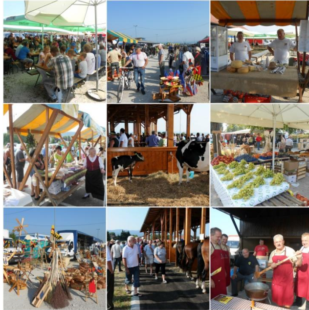
Slika 1: Dogajanje na sejmu

Šentjernej je znan po mnogih rečeh, ena od teh pa je zagotovo tudi sejem. Šentjerneju - takrat še vasici je sejemske pravice podelil cesar Ferdinand leta 1840, kar pomeni, da imamo že dolgo in močno sejmsko tradicijo.